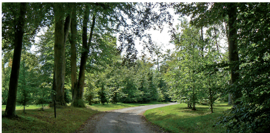
Entrée du domaine des Riffets

Le classement parmi les sites de 1942 visait à préserver les zones boisées, écrans des bâtiments du manoir, de l'église et du château des Riffets. Malgré les ravages provoqués par la tempête de 1999, les bois ont été nettoyés et replantés. En outre, cette protection a préservé le nord et l'ouest de Bretteville de toute urbanisation, même si, au sud, quelques pavillons récents se dressent en limite du site. Sans être exceptionnel, l'ensemble offre, à l'entrée nord de la commune (et depuis le bourg) un espace boisé des plus agréables où le manoir de Quilly et son église sont les seuls témoins du passé de la commune détruite en août 1944.