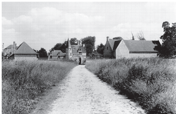
Entrée du manoir de Quilly au début du XX e siècle

cour d'un ensemble déjà voué à l'agriculture. Un parc clos de murs entoure les constructions avec, au sud-ouest, un bois d'érables, de hêtres et de frênes parcouru d'allées. Galeron, dans sa statistique de l'arrondissement de Falaise, le décrit en 1828 : « ... Le parc, entouré de murs et formé de jolis massifs d'arbres verts, est d'un aspect très agréable au-dessous des champs, encore très dégarnis, qui s'étendent entre Cintheaux et Langannerie. Du reste, l'intérieur en a été négligé,