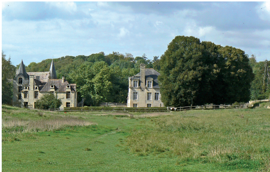
Le manoir de Quilly dans son vallon