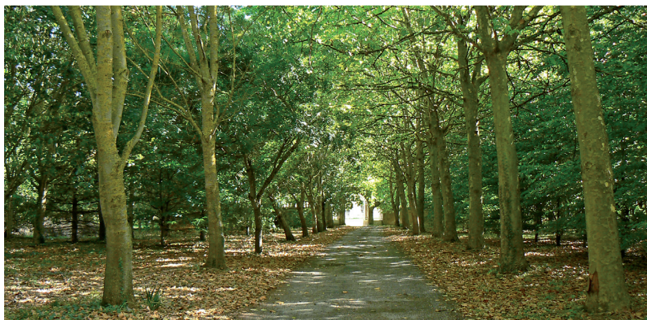
Entrée du manoir de Quilly

Sur la D 183 qui descend de Cintheaux, le bois de Quilly borde la limite nord-est du site avec son mur de clôture longé par un petit chemin. Sur la route, quelques brèches laissent apercevoir un vallon humide, couronné du bois de Quilly. Tout au fond,